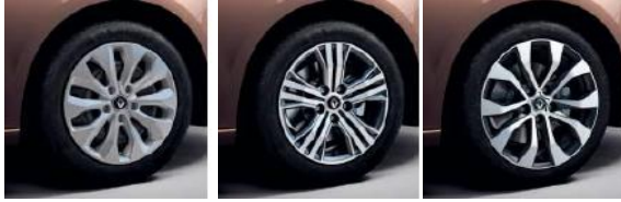
Jante otel 16", design Florida